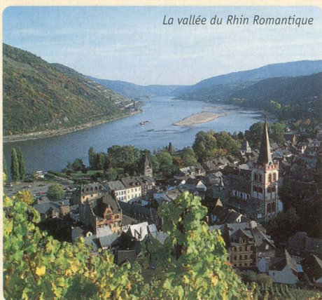
La vallée du Rhin Romantique

SUISSE ROMANDE - STRASBOURG - COBLENCE - RÜDESHEIM - SPIRE - STRASBOURG - SUISSE ROMANDE