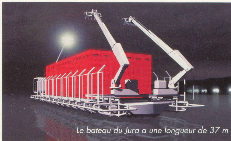
Le bateau du Jura a une longueur de 37 m

Une ancienne barge transformée en espace culturel représentera le Jura au sein d'Expo.02. Les créateurs de ce bateau pirate ont joué la carte de l'impertinence, afin de mettre un peu de piment sur les Trois-Lacs.