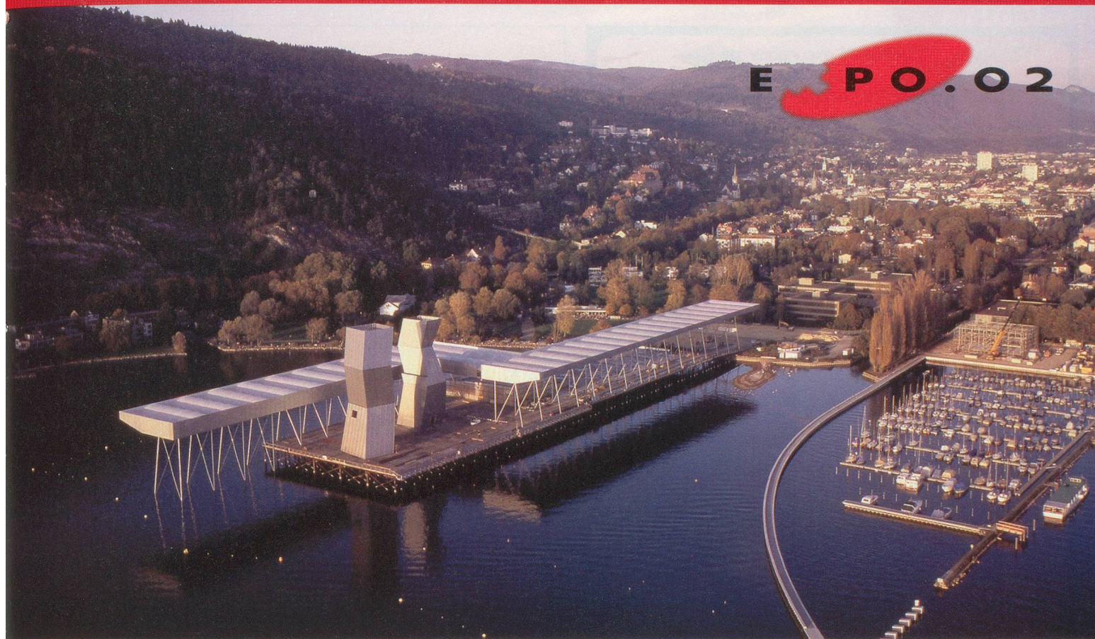
Expo.02 / Mirei Lehmann

d'approcher une certaine forme de bonheur. La première pièce, assombrie, recrée des instants de bonheur acoustiques; la deuxième, éclairée, joue sur le sentiment de la nostalgie; la troisième, accessible à travers un tunnel, permet d'évacuer l'agressivité; la quatrième évoque le succès