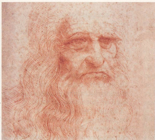
Léonard de Vinci, autoportrait

La Joconde ne s'est pas arrêtée à Martigny. Mais Léonard de Vinci, lui, y fait halte.