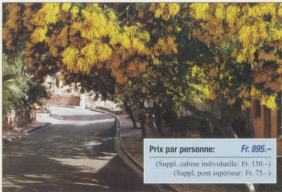
Vision enchantée à Bormes-les-Mimosas

Inclus dans le prix: le transfert en car aller et retour; la croisière en pension complète, du déjeuner du premier jour au petit déjeuner du dernier jour; le logement en cabine extérieure climatisée, douche et w.-c.; le drink d'accueil; l'assistance de notre hôtesse; un accompagnant; les taxes portuaires; l'animation avec le Duo Atlantis. (Non compris: assurances, boissons, excursions facultatives, les pourboires).