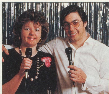
Le Duo Atlantis pour l'animation