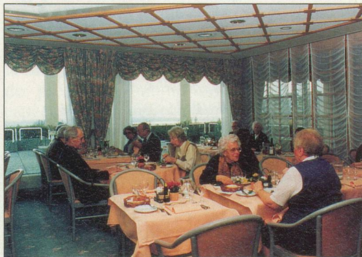
Le restaurant Le Drakkar, à La Gracieuse

Renseignements: La Gracieuse, 1024 Lonay, tél. 021/804 51 51.