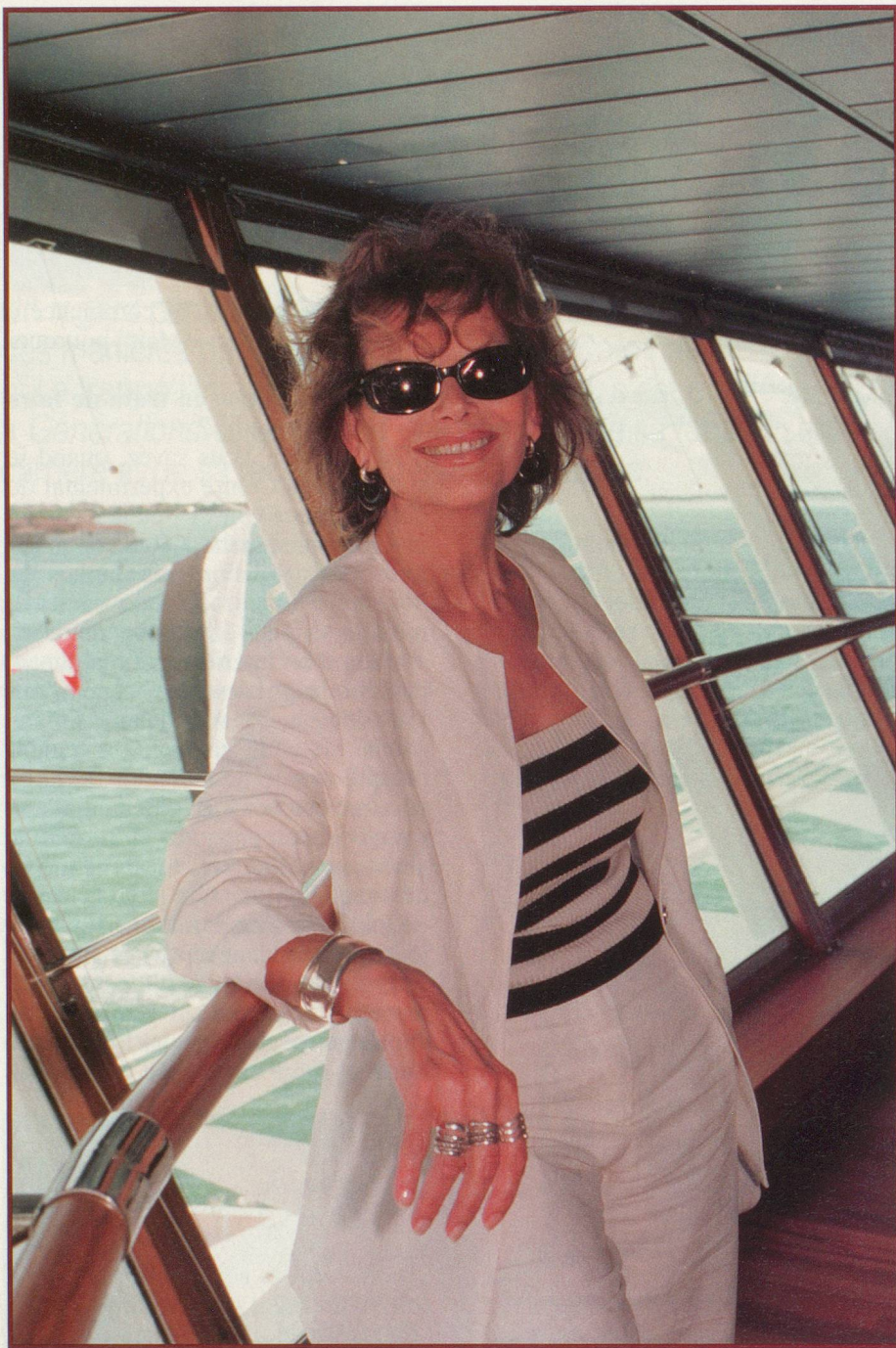
Claudia Cardinale en capitaine de yacht, un rôle complètement improvisé

parce que j'ai toujours pensé que ce n'était pas une bonne chose de se construire un masque.