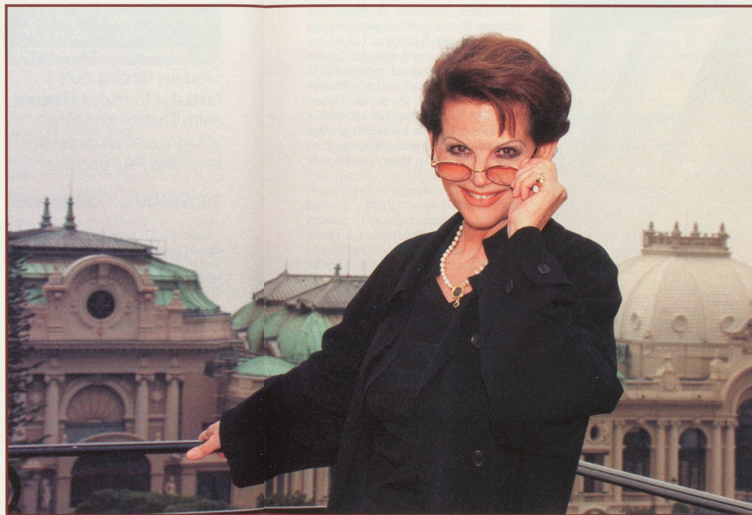
Depuis la terrasse de son appartement, Claudia Cardinale jouit d'une vue superbe sur les toits de Paris

– Quand j'ai reçu la Légion d'honneur, il y a deux ans, le président Jacques Chirac m'a dit: «Vous êtes en quelque sorte la représentation de l'Europe.» En effet, je suis multiculturelle. Je suis née à Tunis, mais mes origines sont siciliennes. Mes arrière-grand-parents étaient natifs d'une petite ville proche de