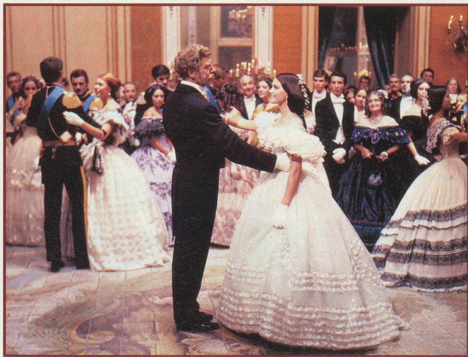
Dans le film de Visconti Le Guépard , elle danse avec Burt Lancaster

Son premier film: Chaînes d'or (1956); Rocco et ses frères , Luchino Visconti (1960); Napoléon à Austerlitz , Abel Gance (1960); Les Lions sont lâchés , Henri Verneuil (1961); Cartouche , Philippe de Broca (1962); La Viaccia , Mauro Bolognini (1962); Huit et demi , Federico Fellini (1963); Le Guépard , Luchino Visconti (1963); La Panthère rose , Blake Edwards (1963); Circus World , Henry Hathaway (1964); Le Cocu magnifique , Antonio Pietrangeli (1964); Il était une fois dans l'ouest , Sergio Leone (1968); Les Pétroleuses , Christian-Jaque (1971); La Scoumoune , José Giovanni (1972); Jésus de Nazareth , série TV, Franco Zeffirelli (1977); Fitzcarraldo , Werner Herzog (1981); Le Ruffian , José Giovanni (1983); L'Été prochain , Nadine Trintignant (1985); Hiver 1954 , L'Abbé Pierre, Denis Amar (1989); La Révolution française , Robert Enrico (1989); Mayrig , Henri Verneuil (1991); 588 rue Paradis , Henri Verneuil (1992). En outre, Claudia Cardinale a tourné neuf films sous la direction de son compagnon, Pasquale Squitieri: I Guappi (1974), Il Prefetto di ferro (1977), Corleone (1977), L'Arma (1978), Claretta (1984), Naso di cane (1987), Atto di dolore (1991), Briganti (1999) et Elisabeth , TV (1999).