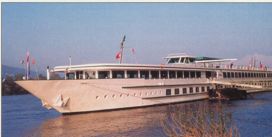
Le MS Rhône Princess au fil de l'eau

Lundi 29 octobre. Le matin, visite guidée facultative de Lyon. Déjeuner à bord et continuation jusqu'à Collognes-au-Mont-d'Or. Escale devant