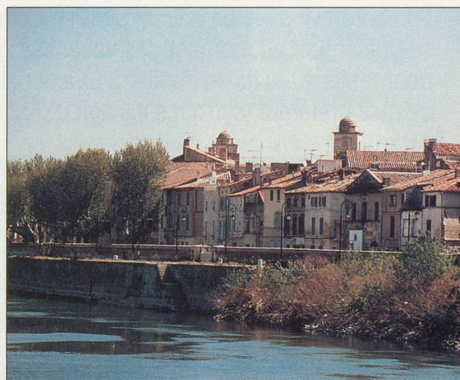
Une vue de la charmante cité arlésienne

(Suppl. cabine indiv. Fr. 100.-) (Suppl. pont supérieur Fr. 60.-)