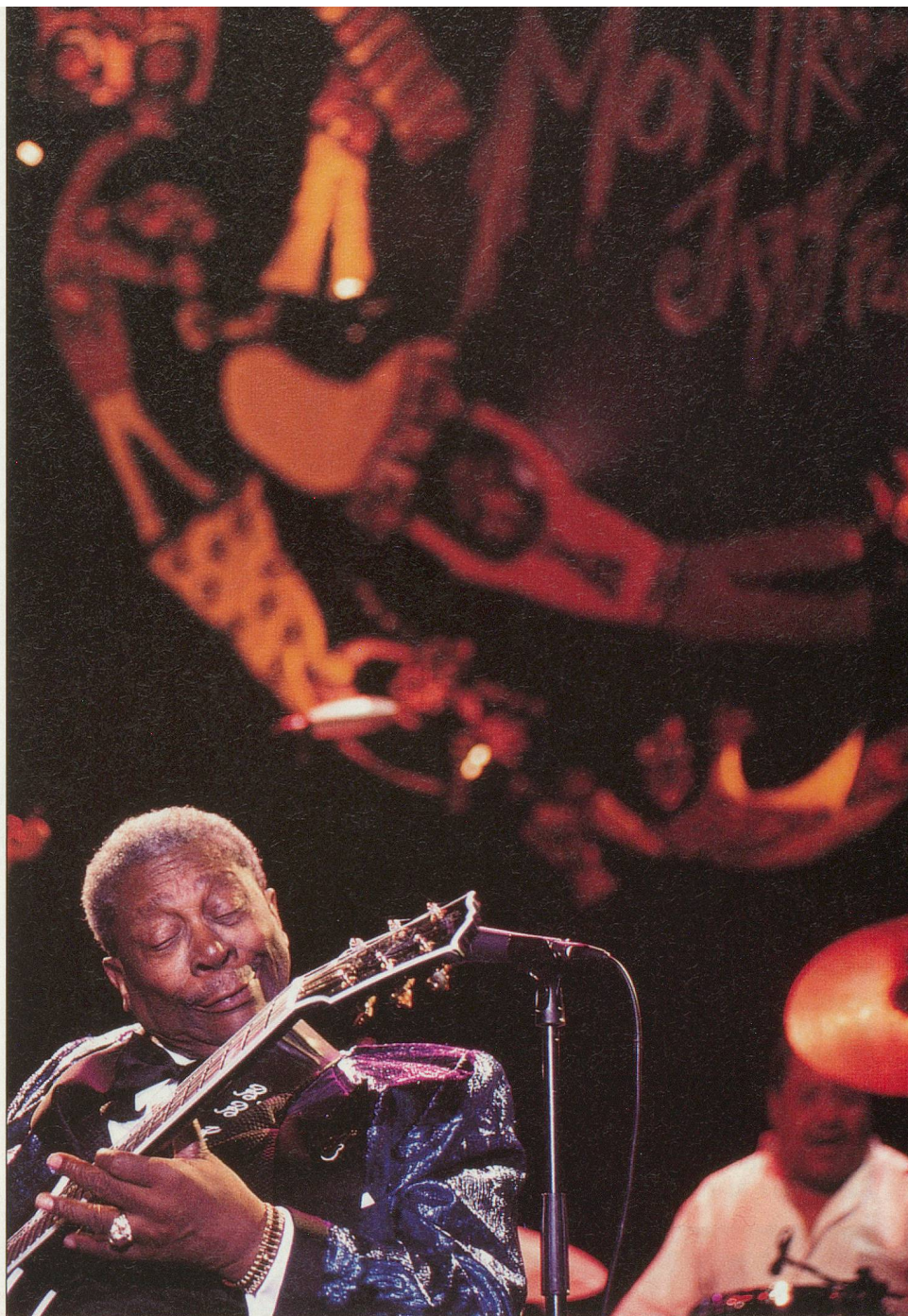
B.B. King sera présent au Montreux Jazz Festival