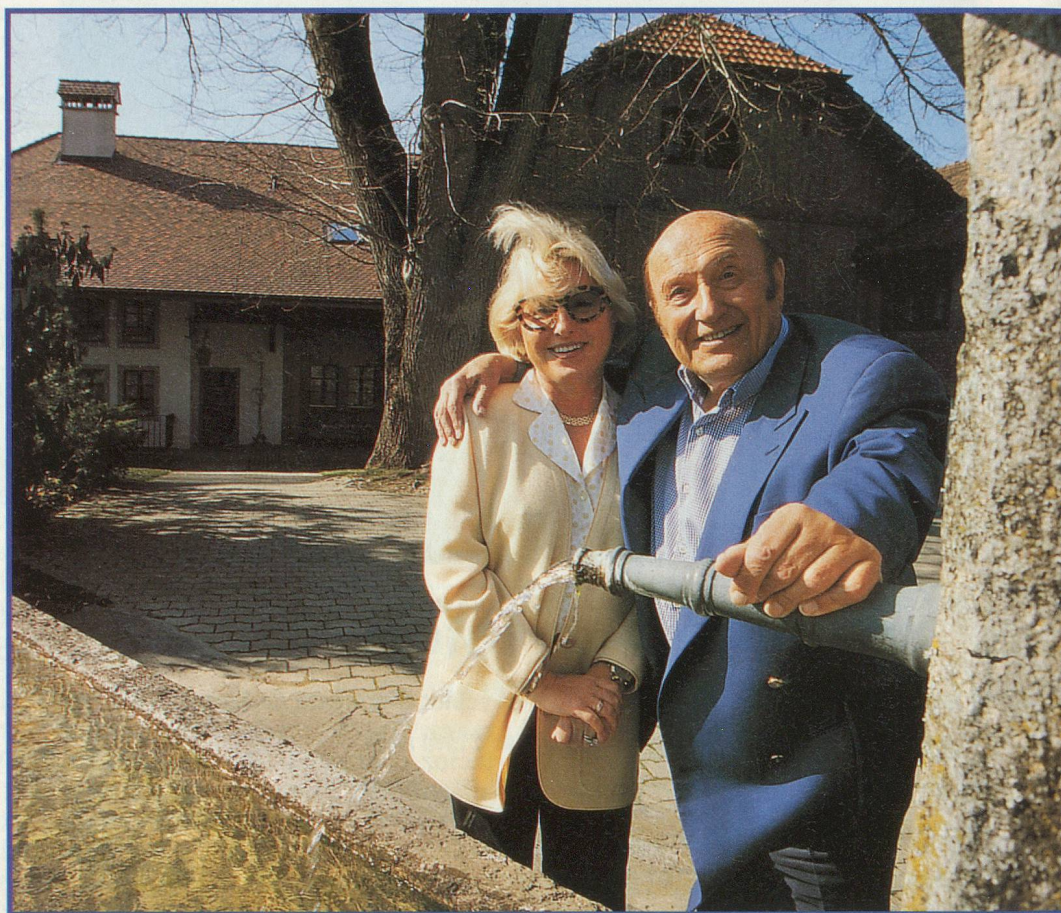
Frédéric Dard avait la rage d'écrire

«Plus je vieillis et moins je me prends au sérieux, m'avait-il avoué. Je ne me suis d'ailleurs jamais beaucoup intéressé à ce que l'on pensait de mes livres. Depuis qu'on glose sur mes bouquins, j'ai toujours l'impression qu'il s'agit d'un autre que moi. Je suis écrivain jusque dans la moelle, et pourtant je ne me sens pas écrivain. Je ne suis qu'un artisan de la plume, un pisseur de copie. Et je vais te faire une confidence, je n'ai rien à dire... Alors, pourquoi est-ce que j'écris? Parce que j'écris! Tu n'aurais pas idée de demander à un escargot pourquoi il fait de la bave. C'est dans sa nature de laisser un sillage argenté derrière lui, voilà tout. Je ne me regarde jamais écrire, j'écris. Et si j'écris tellement – 300 romans, 172 San-Antonio – c'est parce que j'en ai besoin. Pas financièrement, mais physiquement, mentalement. Ecrire est tellement lié à