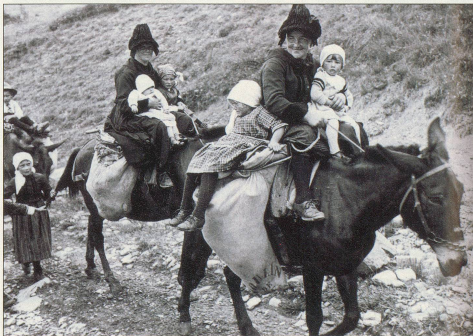
Toute la famille se déplaçait avec son mulet