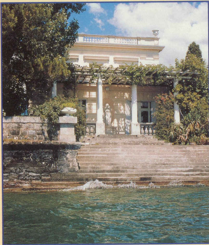
La villa de Salagnon, au large de Clarens, un rêve italien