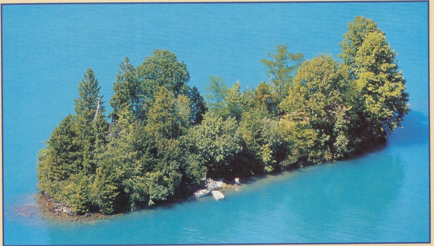
L'île des Escargots, ou Schneckensinsel, près d'Iseltwald, à quelques kilomètres d'Interlaken (BE)