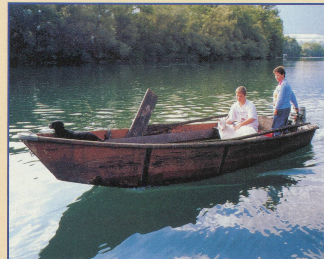
Pour aller à l'école, le bateau à moteur est indispensable

Pour les insulaires, la vie est particulière, même en Suisse. Sur l'île de Länggrein, sur l'Aar, à six kilomètres en amont de Soleure, une famille de paysans cultive aujourd'hui encore les sept hectares de cette terre en forme de losange, bordée d'arbres. Pour les enfants, un seul moyen d'aller à l'école, la barque à moteur. Et c'est grâce à un