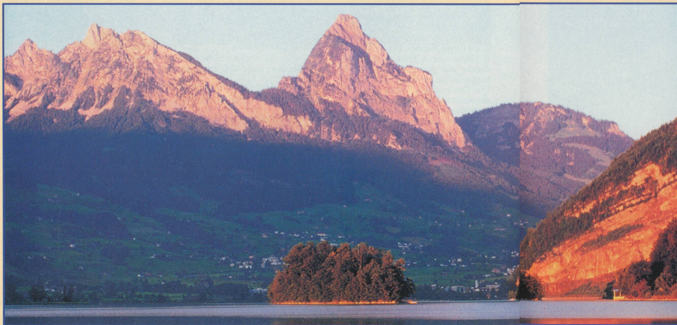
L'île de Schwanau, lieu d'excursion apprécié, sur le Lauersee, près de Schwyz

bac de dix tonnes que ces agriculteurs charrient régulièrement sacs d'ordures, bétail et autres outils indispensables.