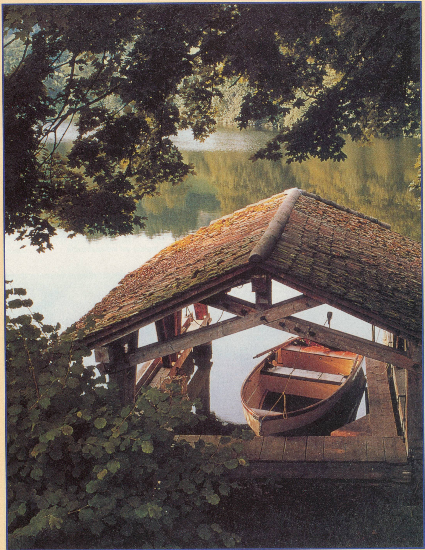
Sur le Mauensee, une île privée de l'arrière-pays lucernois