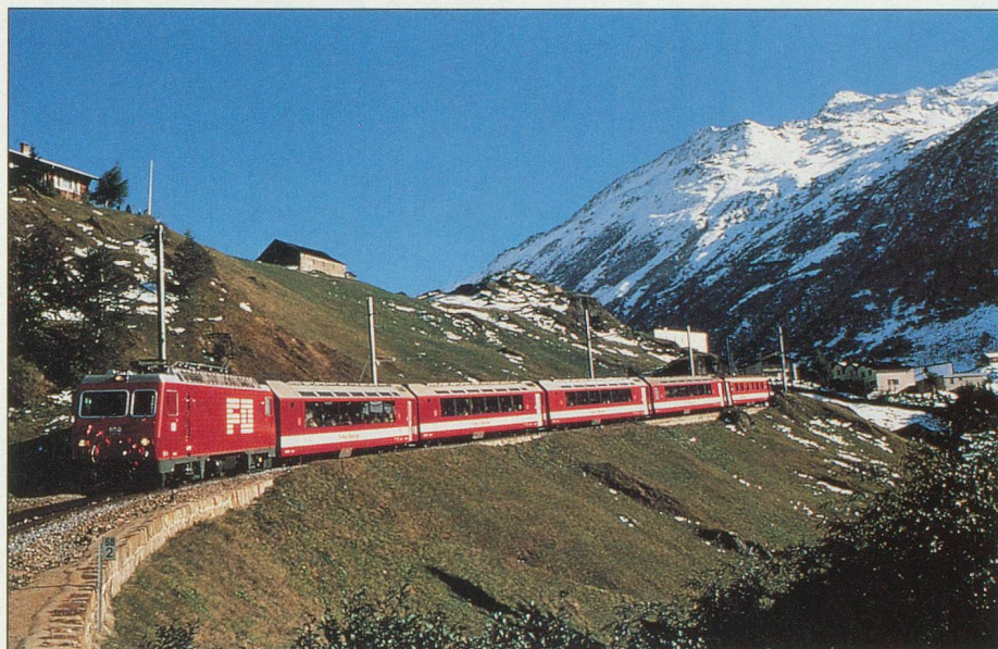
Un panorama d'une grande beauté

Mardi 3 juillet: Petit-déjeuner à l'hôtel. Journée consacrée à la découverte de cette magnifique région de l'Engadine. 10 h: départ en bus pour Pontresina. A partir de Pontresina, continuation en calèche jusqu'à Val Roseg. Repas de midi et retour en calèche, puis en car jusqu'à Saint-Moritz. Repas du soir à l'hôtel, logement à l'hôtel.