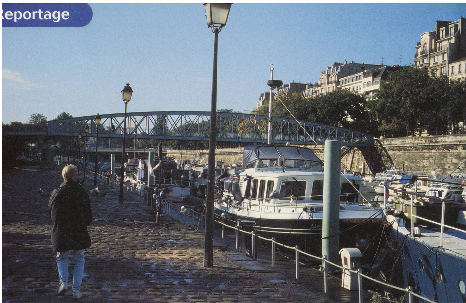
Entre la Seine et la Bastille, il fait bon flâner sur le port de Paris

siècle. Souvenons-nous, en passant, que le poète François Villon manqua de peu de s'y balancer et qu'il y composa sa Ballade des pendus .