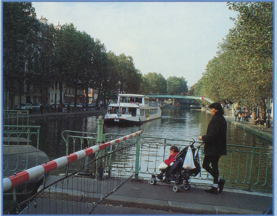
La rue Dieu tourne sur elle-même pour laisser le passage aux bateaux

A quelques pas du canal, peu après l'Hôpital Saint-Louis, une plaque commémorative rappelle l'emplacement du tristement célèbre gibet de Montfaucon. Au numéro 49 de la rue de la Grange-aux-Belles rôdent encore les fantômes de milliers de pendus exécutés entre le 14 e et le 17 e