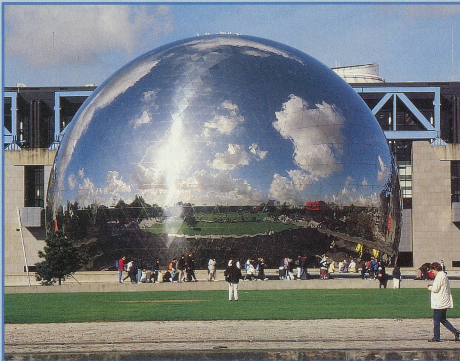
Au bout du bassin de la Villette trône l'imposante géode