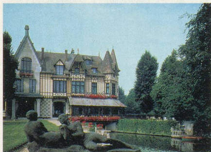
Un charmant hôtel en Normandie

Vendredi 5 mai. Matinée libre au Mont-Saint-Michel, spectacle de la marée. L'après-midi, excursion vers Saint-Malo, l'ancienne ville des corsaires. Visite de la ville et promenade sur les remparts.