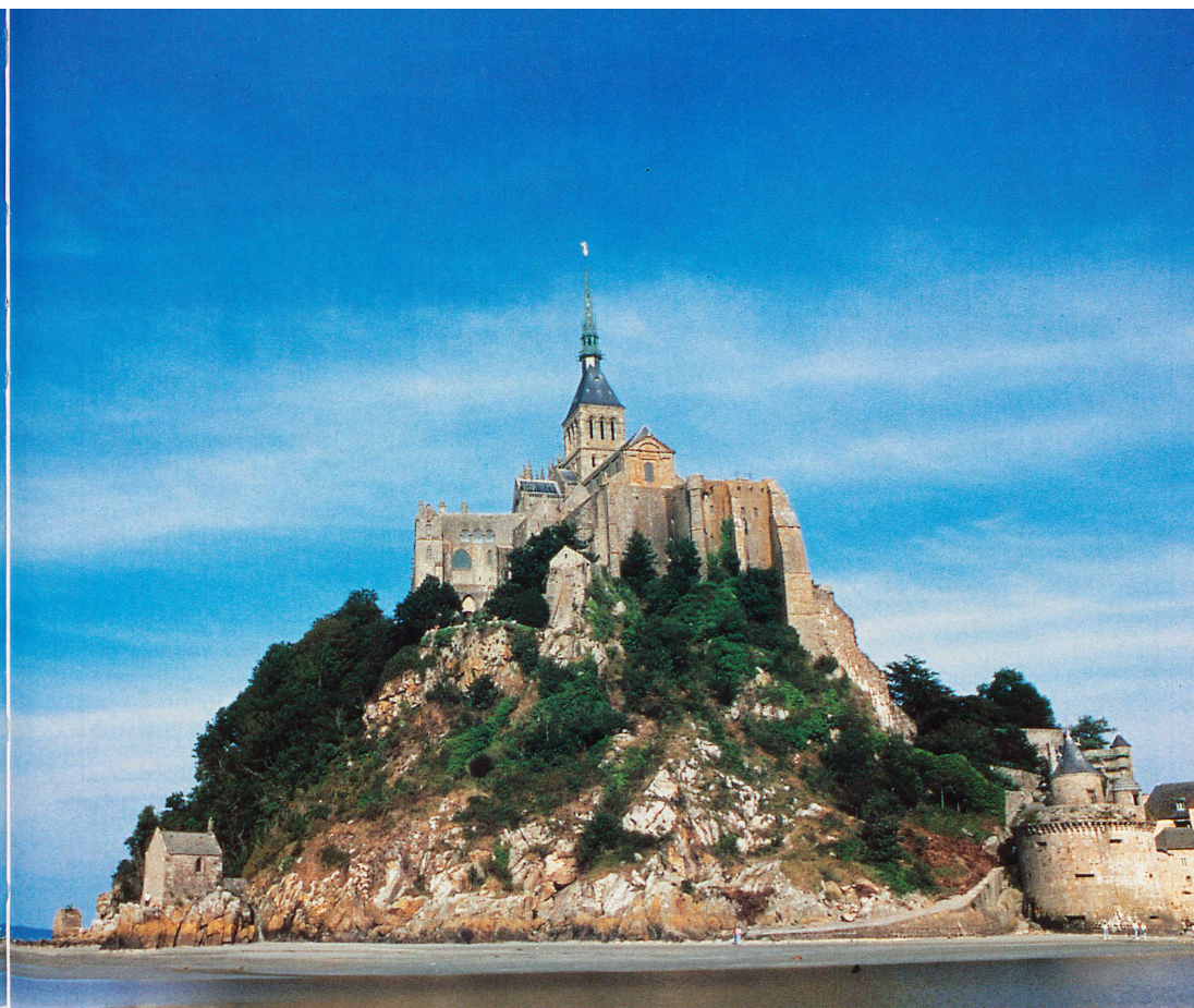
Le Mont-Saint-Michel, un ensemble majestueux où le spirituel et la gastronomie font bon ménage

dans l'indifférence quasi générale. Ici, l'imprudence se paie comptant et ça coûte cher!