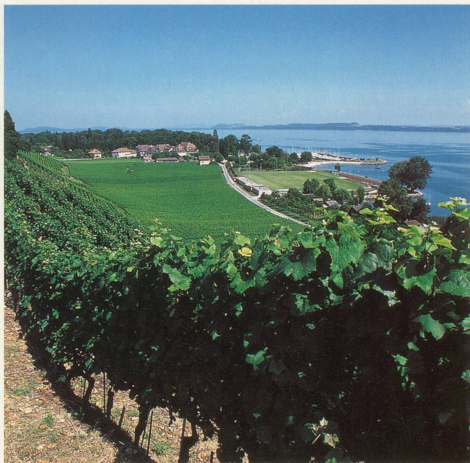
Le sentier descend en plein vignoble