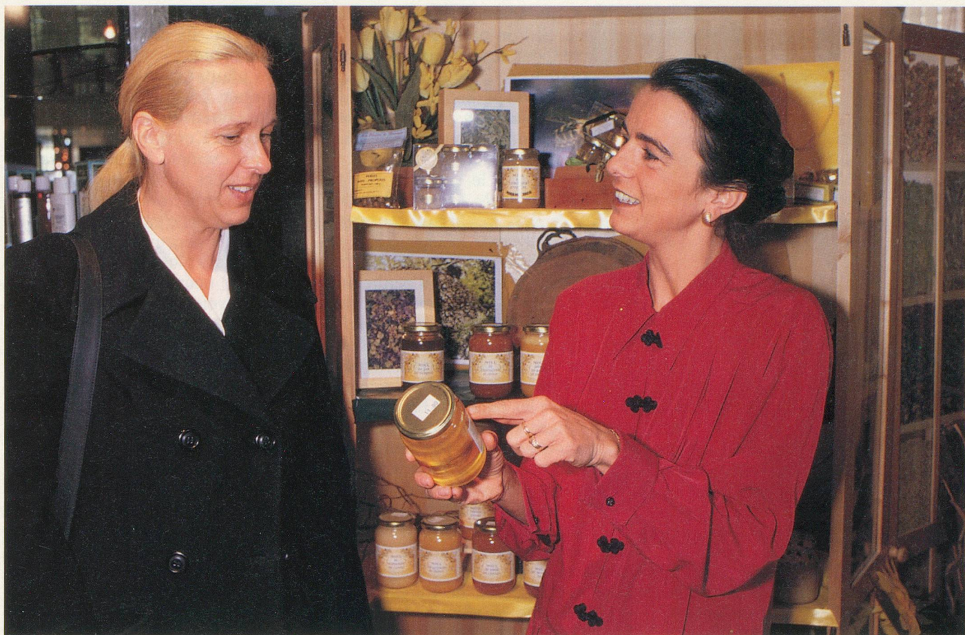
Les miels les meilleurs, sélectionnés par une apicultrice, sont en vente à L'institut

recette, une préparation de plantes, le plus souvent en tisanes à boire tout au long de la journée. Je suis l'évolution et je peux modifier la posologie en fonction des réactions du malade. Le travail se fait à long terme.