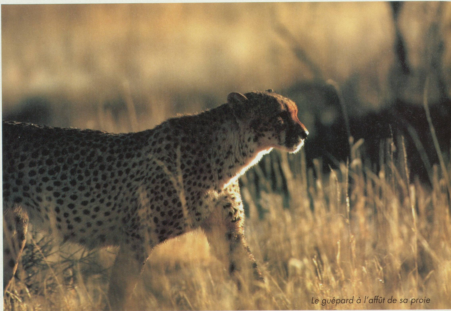
Le guépard à l'affût de sa proie