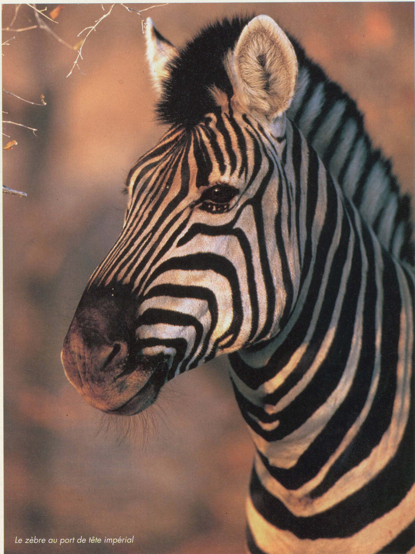
Le zèbre au port de tête impérial