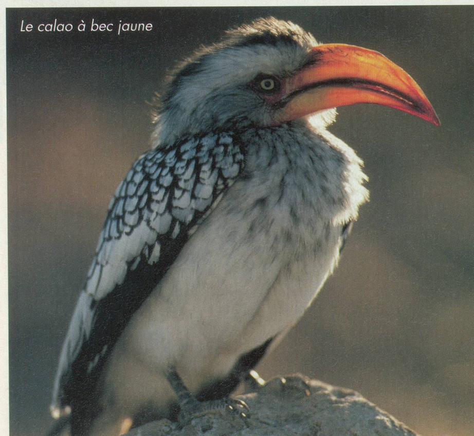
Le calao à bec jaune