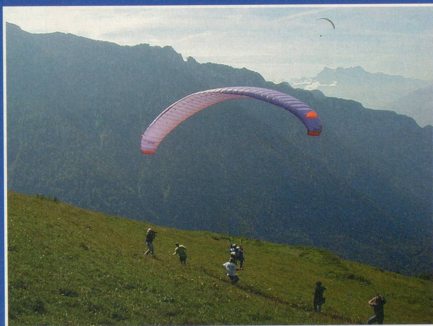
Un décollage en douceur