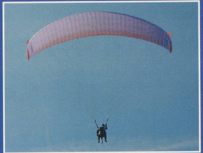
«Je suis l'airbag du pilote» plaisante «Madzou»