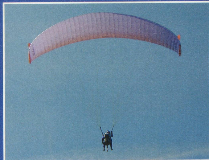
«Je suis l'airbag du pilote» plaisante «Madzou»