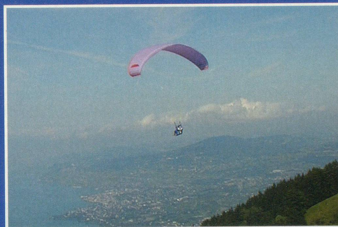
Le bonheur de contempler le panorama lémanique