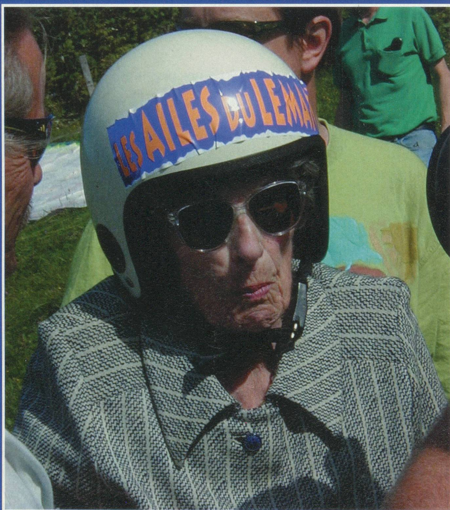
«Madzou» prête à voler