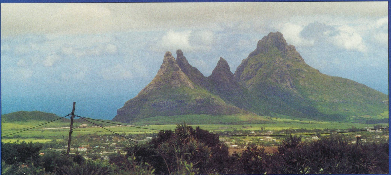
Les paysages de cette île sont d'une grande richesse: curieuses montagnes, gorges sauvages, immenses champs de canne à sucre, plantations de thé verdoyantes (ici la côte ouest).