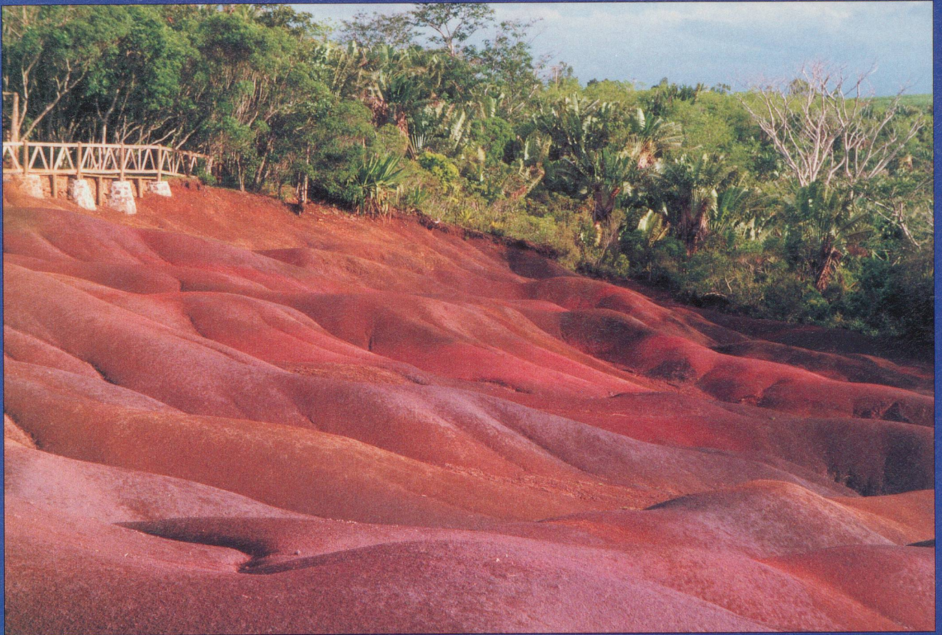
A part les plaisirs de la baignade, tous les deux jours nous étions en excursion organisée afin de visiter les plus beaux endroits (ici les Terres de Chamarel) Willy Cuany, Lausanne