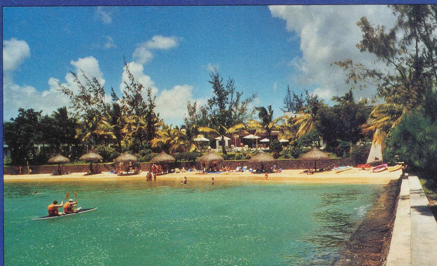
L'hôtel est situé dans un magnifique cadre, en bordure de mer, tout entouré de palmiers et de végétation luxuriante. Willy Cuany, Lausanne

Amitiés et bon voyage aux prochains partants! B. P.