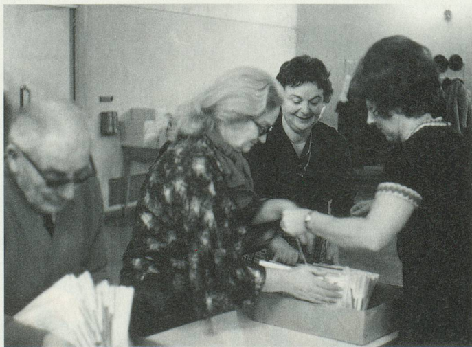
La mise sous pli du magazine, par une équipe de bénévoles, dans la paroisse de Saint-Marc, à Lausanne