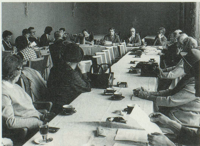
En 1972, l'une des premières assemblées des membres de la Société coopérative Aînés