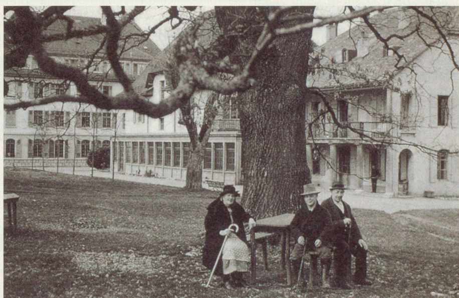
Sous le grand chêne, vers 1932

Loëx 1900-2000 – L'Asile, la maison, l'hôpital dans la presqu'île , par Armand Brulhart, coédité par les HUG et Georg Editeur.