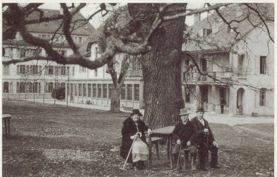
Sous le grand chêne, vers 1932

Loëx 1900-2000 – L'Asile, la maison, l'hôpital dans la presqu'île , par Armand Brulhart, coédité par les HUG et Georg Editeur.