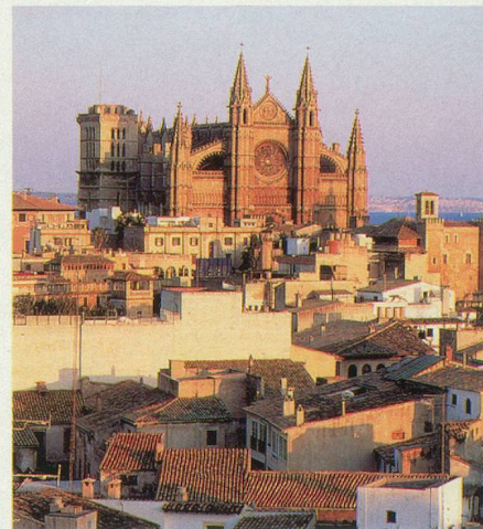
Vue générale de Palma

Du dimanche 1 er au vendredi 6 octobre. Séjour balnéaire de détente sur la plage et à l'hôtel, en demi-pension. Possibilité d'effectuer des excursions facultatives à travers l'île.