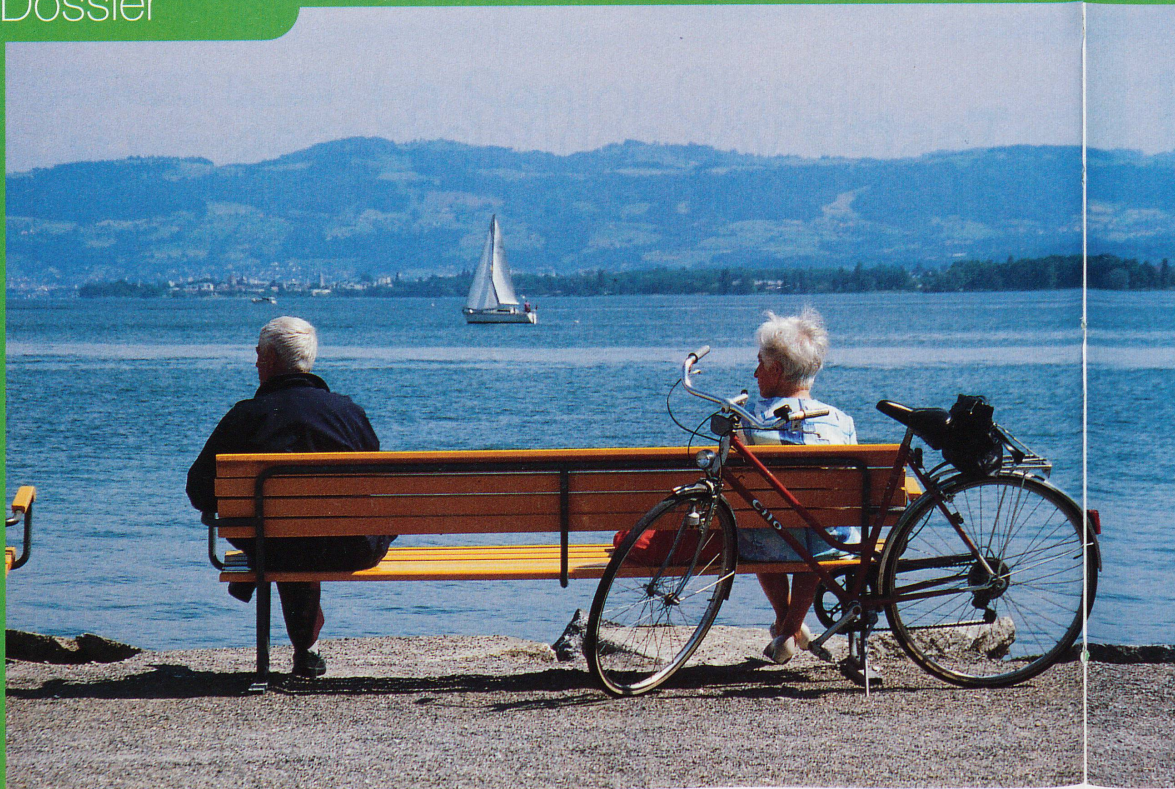
Balade idyllique à Romanshorn, sur les bords du lac de Constance