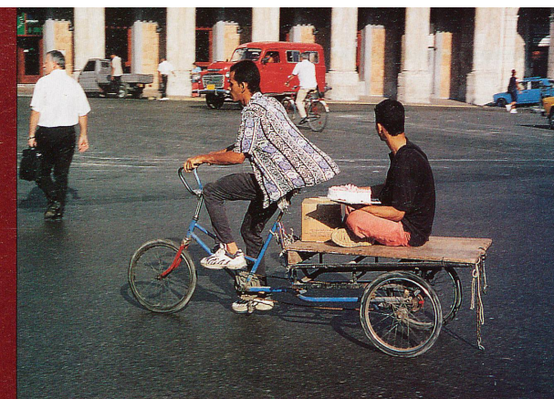
Tous les moyens sont bons pour se déplacer dans les rues de La Havane