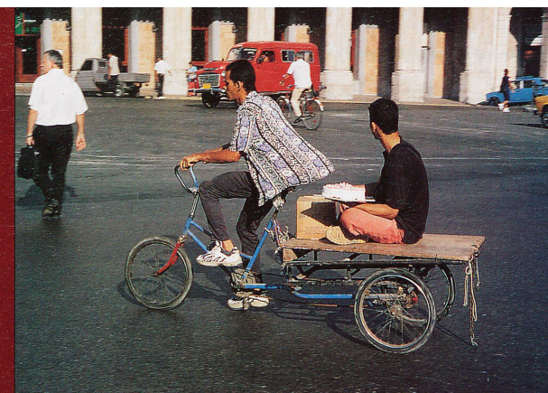
Tous les moyens sont bons pour se déplacer dans les rues de La Havane