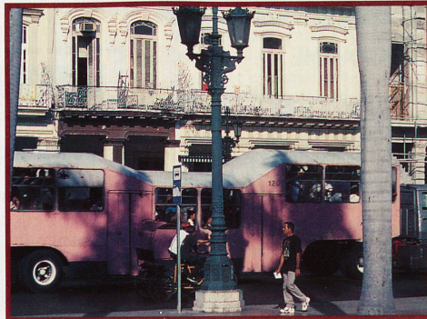
Trois cents passagers se serrent dans les célèbres bus roses, baptisés «chameaux»