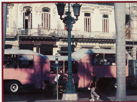
Trois cents passagers se serrent dans les célèbres bus roses, baptisés «chameaux»