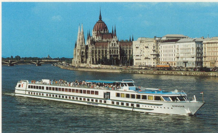
Un voyage inoubliable sur le beau Danube

Visitez Vienne et Budapest de façon originale! A bord du MS Bohème , un hôtel flottant très confortable, vous sillonnerez le Danube à la découverte des trésors de l'ancien empire austro-hongrois.