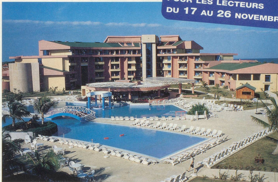
Le superbe Hôtel Coralía Club Playa de Oro, à Varadero

Mercredi 22 novembre. Visite de la ville de Cienfuegos et du Théâtre Terry, du Malecon et du Paseo del Prado. Déjeuner au Restaurant du