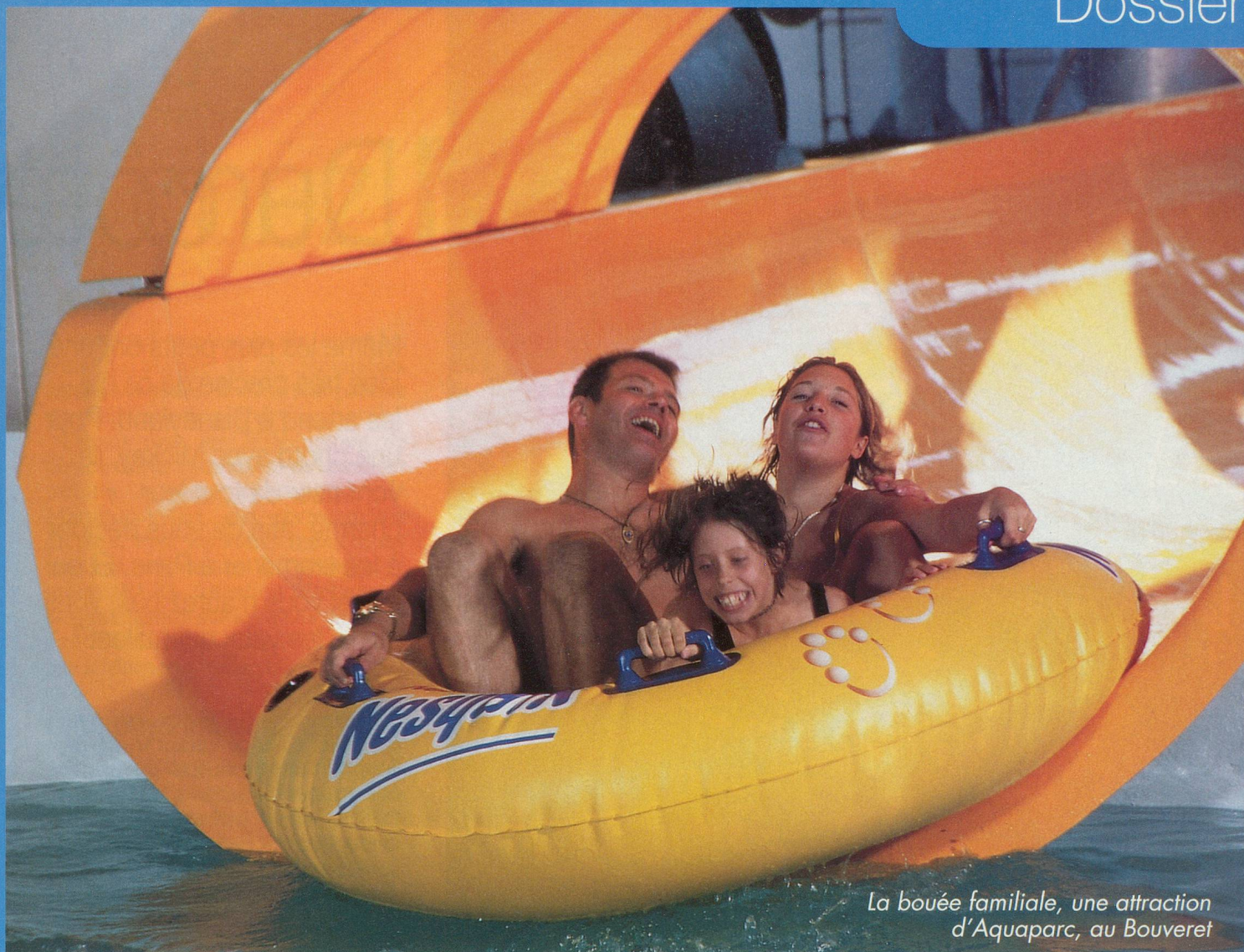
La bouée familiale, une attraction d'Aquaparc, au Bouveret