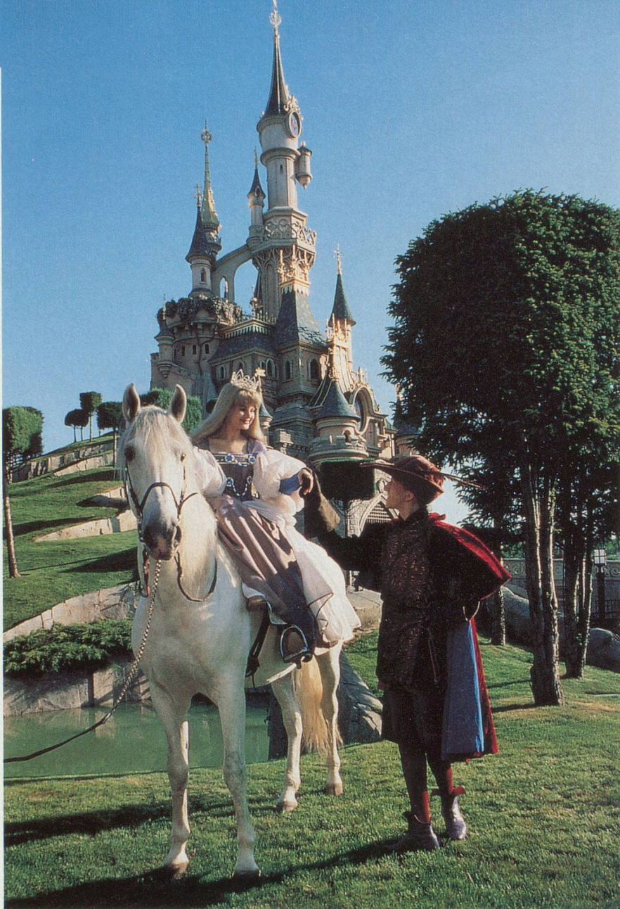
Un prince charmant et sa belle, pour faire rêver les enfants...

lent quelques instants sur la place de jeu de Pocahontas. Cette récréation est bienvenue. Toutes ces attractions requièrent, chez les marmots, une attention qu'ils ont parfois peine à soutenir des heures durant. Et c'est un peu pareil pour les adultes... Dans tout le parc, des restaurants et des cafés aux vastes terrasses permettent aussi un arrêt plus substantiel.