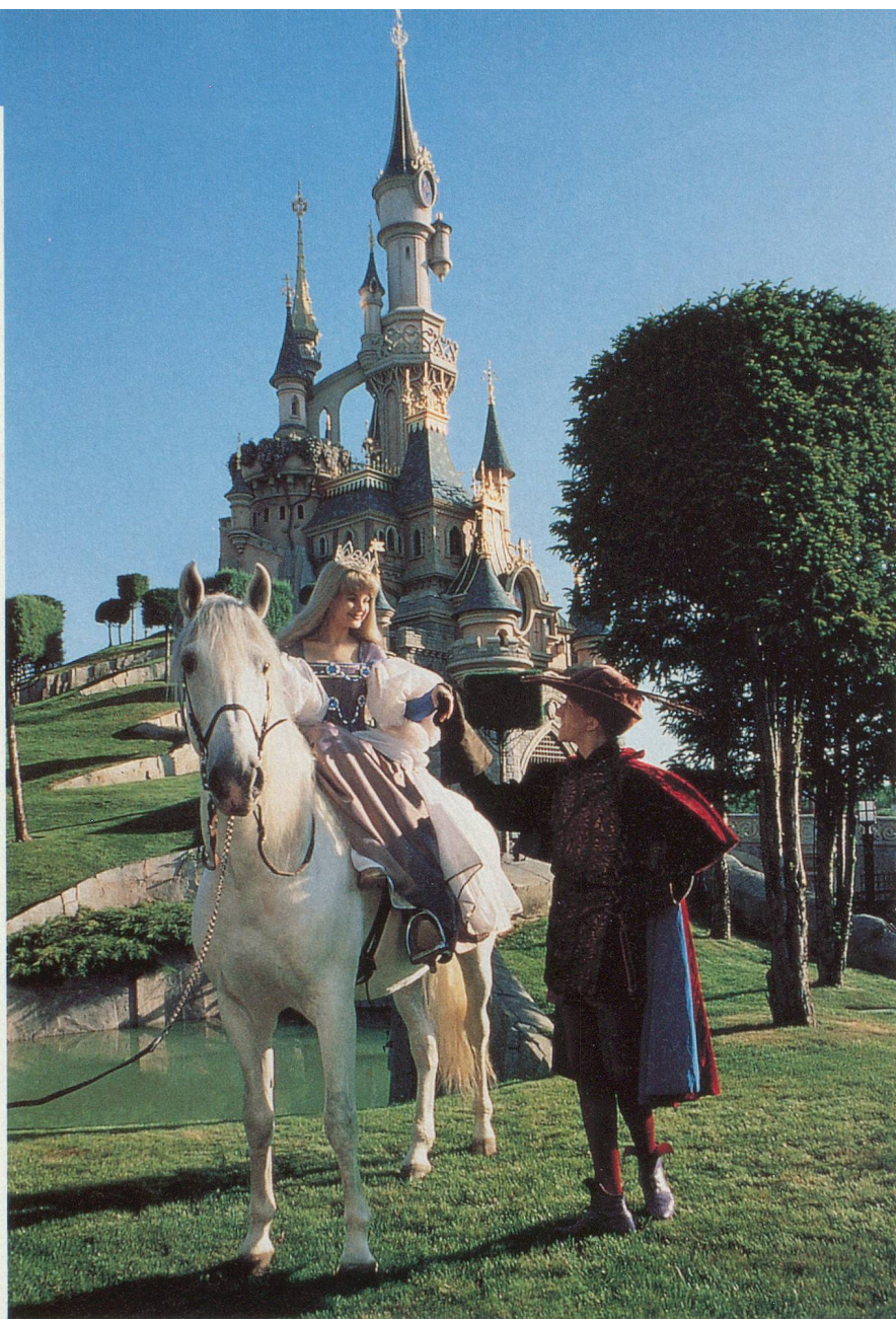
Un prince charmant et sa belle, pour faire rêver les enfants...

lent quelques instants sur la place de jeu de Pocahontas. Cette récréation est bienvenue. Toutes ces attractions requièrent, chez les marmots, une attention qu'ils ont parfois peine à soutenir des heures durant. Et c'est un peu pareil pour les adultes... Dans tout le parc, des restaurants et des cafés aux vastes terrasses permettent aussi un arrêt plus substantiel.