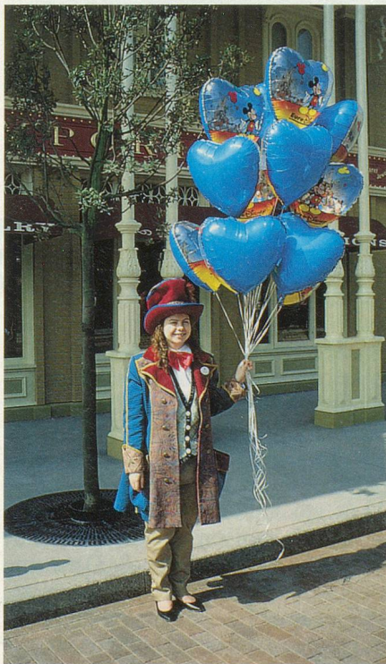
Chez Picsou, tout se vend

Adventureland s'adresse à tous les âges. On peut pénétrer dans l'arbre des Robinsons suisses, fort élégamment meublé. Les enfants se défou-