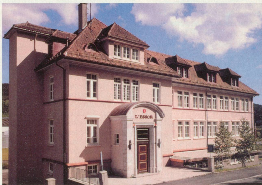
Le Centre culturel de l'Essor, au Sentier, abrite l'Espace horloger

Exposition La lime et l'horloger , Espace horloger de la Vallée de Joux, Le Sentier, jusqu'à fin octobre. (Accès aisé aux personnes à mobilité restreinte).