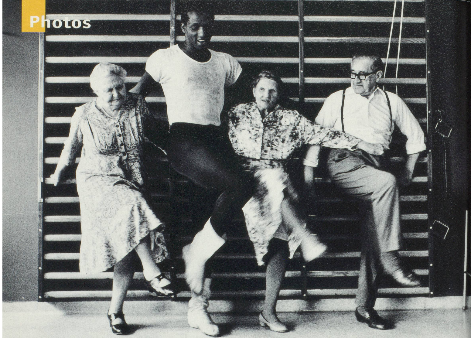
Leçon de jazz-dance dans un EMS de Copenhague