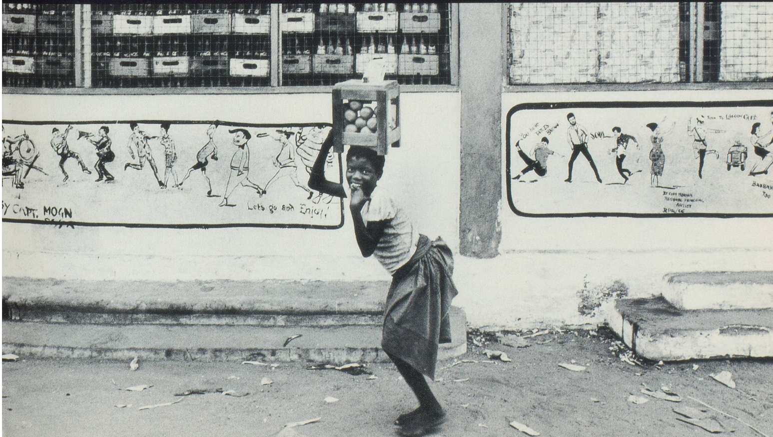
Marchande d'oranges à Accra, Ghana