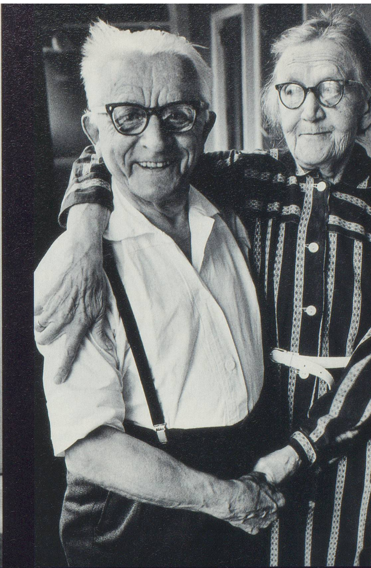
Deux amoureux du troisième âge au Danemark