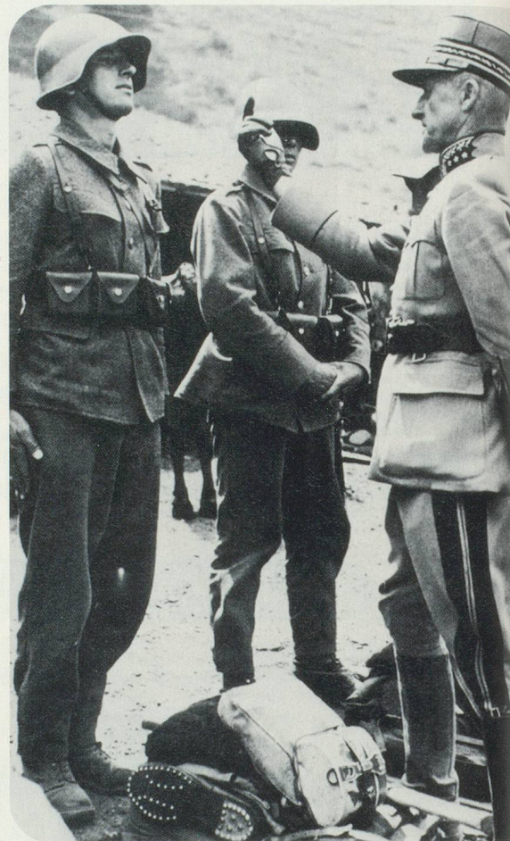
En 1940, il y avait en Suisse 800 000 soldats prêts à défendre leur patrie

Il décrit également les services éminents rendus par la diplomatie suisse comme puissance protectrice auprès de l'Allemagne, de l'Italie et du Japon, ainsi que l'action du CICR pour les prisonniers de guerre.