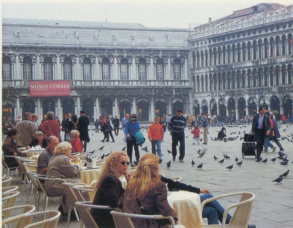
La prestigieuse place Saint-Marc

Prix par personne: Fr. 985.- (avec abonnement demi-tarif) (supplément Fr. 55.- sans demi-tarif) (supplément single Fr. 108.-)