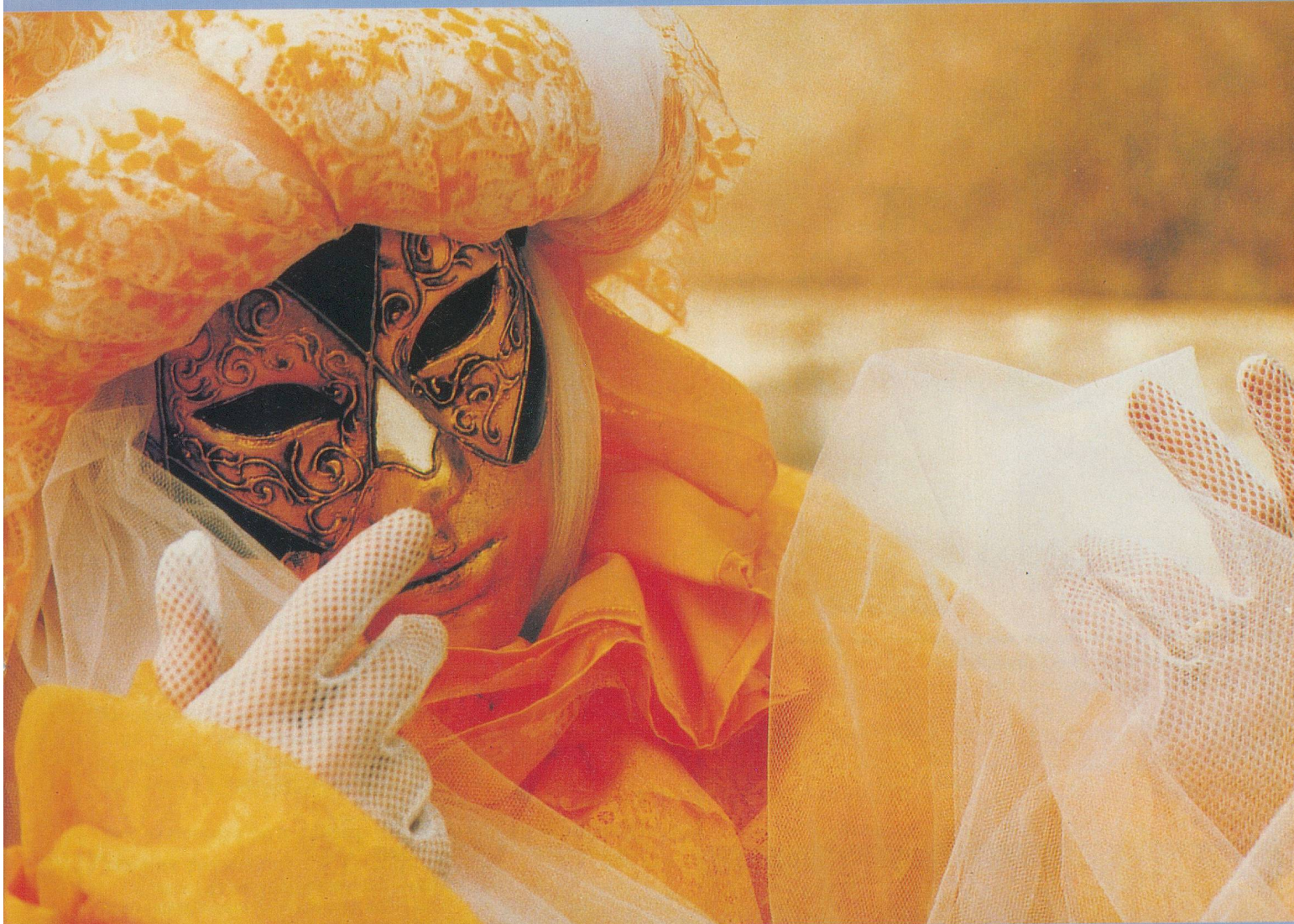
Les costumes sont taillés dans des tissus précieux