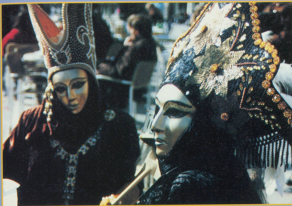
Certaines coiffes sont de véritables chefs-d'œuvre