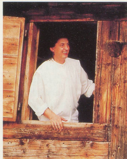
Marc Veyrat: la cuisine autrement

Son marché, Marc Veyrat le fait par monts et par vaux, cueillant au passage la livèche, la bourrache ou la gentiane jaune qui accompagneront ses créations. Et l'hiver, lorsque la neige recouvre les pâturages savoyards, comment fait-il pour assaisonner ses recettes? «C'est simple, répond-il. Le surplus, cueilli durant l'été et l'automne, est soigneusement séché ou congelé. Et puis, la