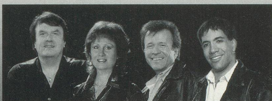
SWEET PEOPLE "Sierra Madre" "Quand on revient d'ailleurs"