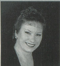
ARLETTE ZOLA "Laissez-moi encore chanter"