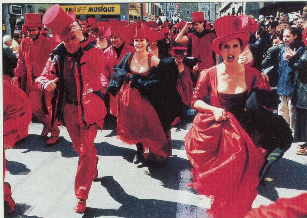
Le Chœur Rouge, fil conducteur du spectacle

Soirée spéciale «Thema» retransmise sur la TSR et sur Arte à l'occasion de la clôture de la fête.