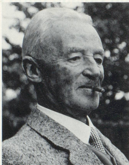
d'hui, sa propriété de Verte-Rive, à Pully, abrite le Centre Général-Guisan.

Cette mission a amené le général Guisan à prendre les décisions stratégiques dictées par la situation et son évolution tout au long de son temps de commandement. Le 20 août 1945, il quittera son commandement avec le sentiment du devoir accompli. L'estime de tout un peuple lui restera acquise jusqu'à sa mort, en 1960, et au-delà. Aujourd'hui,