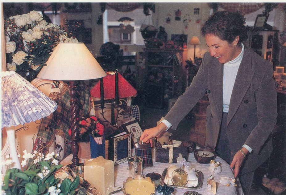
A la Boutique Brocéliande, à Lausanne, des objets pour toutes les bourses

Rasoir Cool Skin , de Philips, en vente en magasins spécialisés.