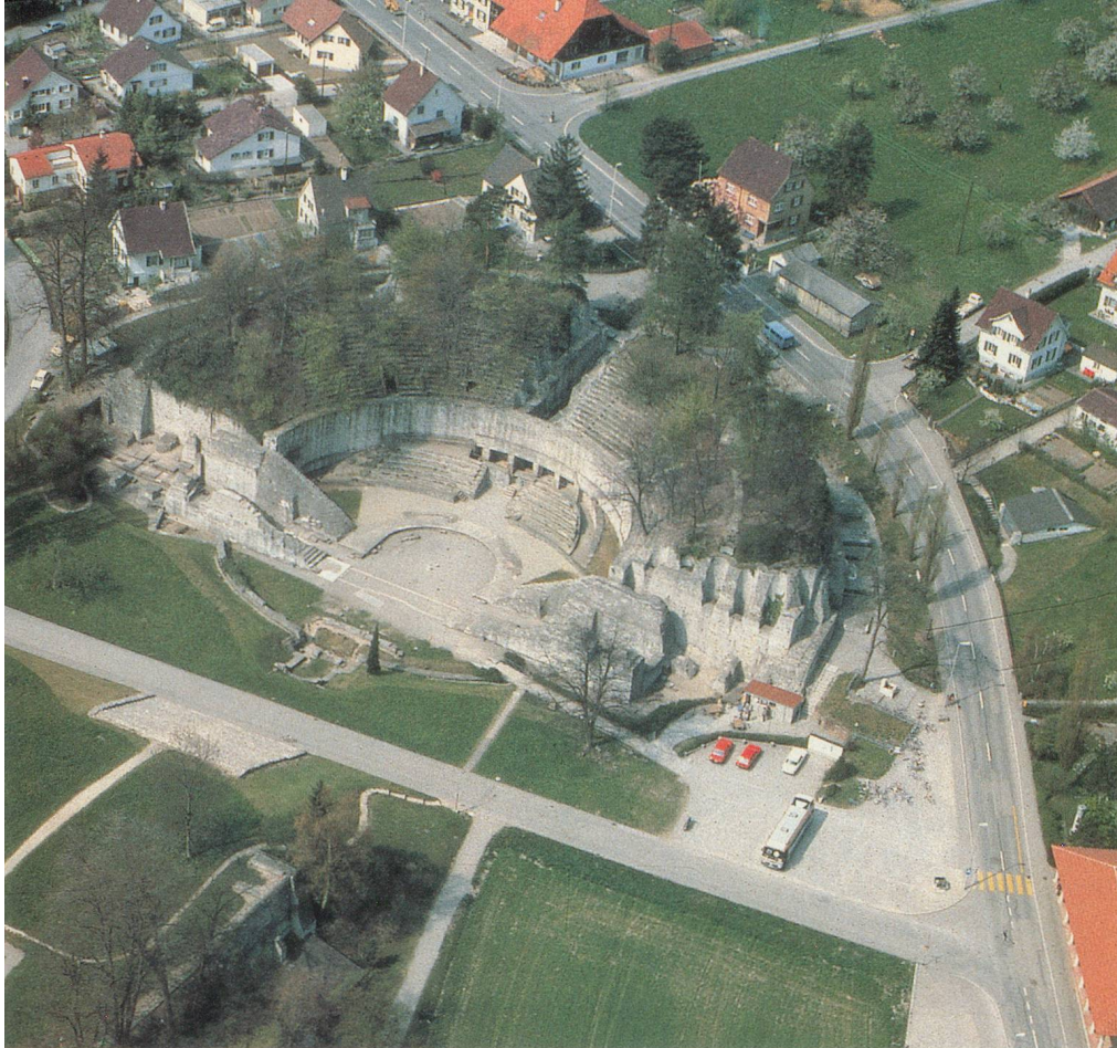
Le site romain d'Augusta Raurica

finement décorées, venues des meilleurs ateliers du monde romain. Au musée d'Augst, une salle est consacrée à ces bijoux que leur malheureux propriétaire, probablement un officier, n'a jamais pu récupérer. Le musée d'Augst est original, puisqu'il reproduit une villa romaine avec ses pièces de séjour, son jardinet intérieur et ses ateliers donnant sur la rue.