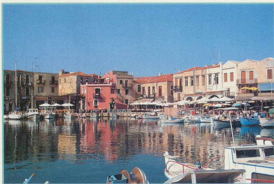
Le port Réthimnon, un havre de paix et de douceur de vivre