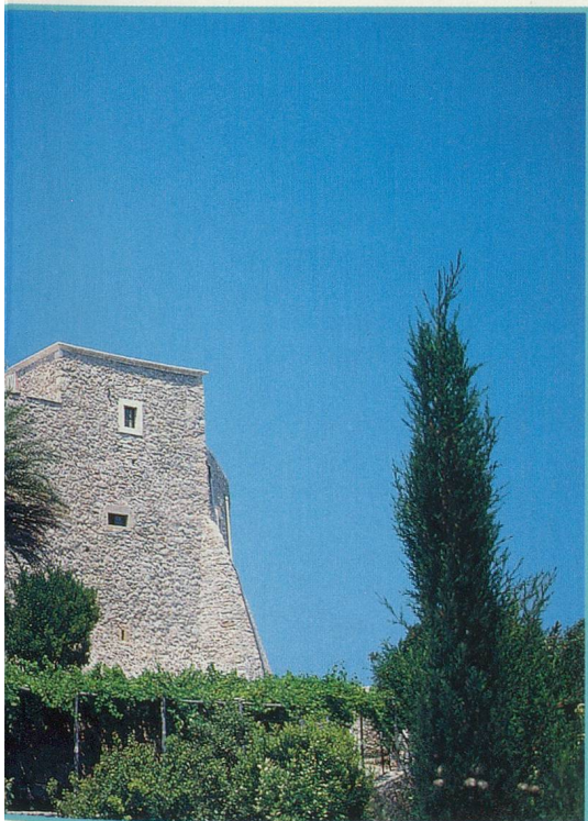
◀ Le monastère de Toplou, à l'est de l'île, date du 13 e siècle

Nikos Kazantzaki, l'auteur de ce passage, personnifie totalement cet esprit crétois forgé dans la rigueur, aspirant au mysticisme, marqué par une foi peu commune en l'avenir héroïque de l'homme et cependant figure hautement bienveillante. Si vous ne l'avez pas encore lu, emportez son célèbre roman «Zorba» dans vos bagages et découvrez – ou redécouvrez! – dans son cadre naturel, ce personnage authentiquement grec.