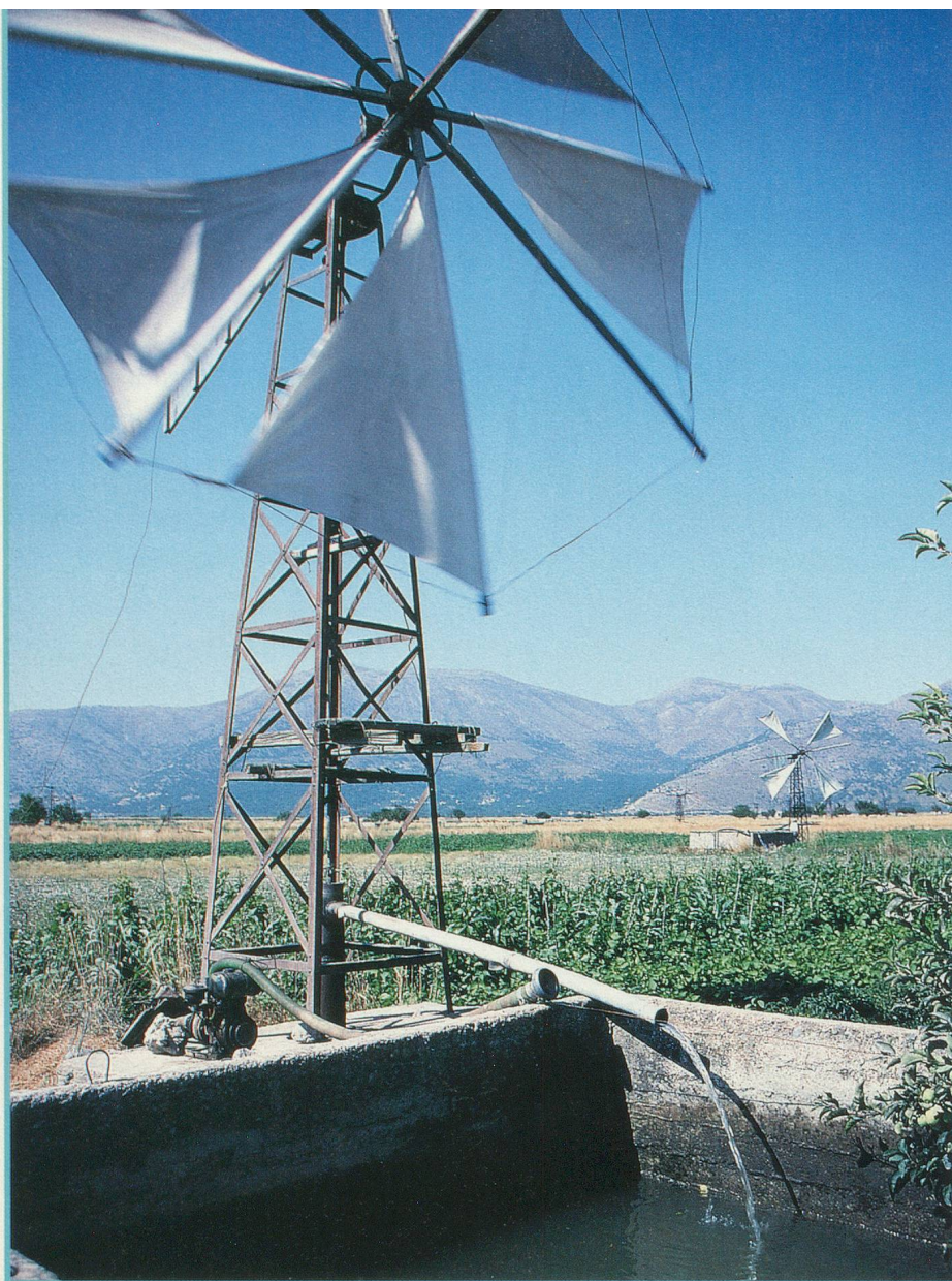
Le plateau du Lassithi et le charme de ses moulins à vent

Pour nous, elle est l'une des plus grandes îles de la Méditerranée, après la Sicile, la Corse, la Sardaigne et Chypre. Pour les Grecs, elle est la plus grecque de leurs îles. Cinq mille ans d'histoire sont enfouis sous douze mètres de terre! Une histoire plus révélatrice aussi que celle de toutes les autres îles et du mystérieux folklore qui entoure les personnages tels que Zeus, Minos et le légendaire Minotaure.