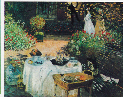
Le Déjeuner à Giverny, 1874. (Musée d'Orsay, Paris)