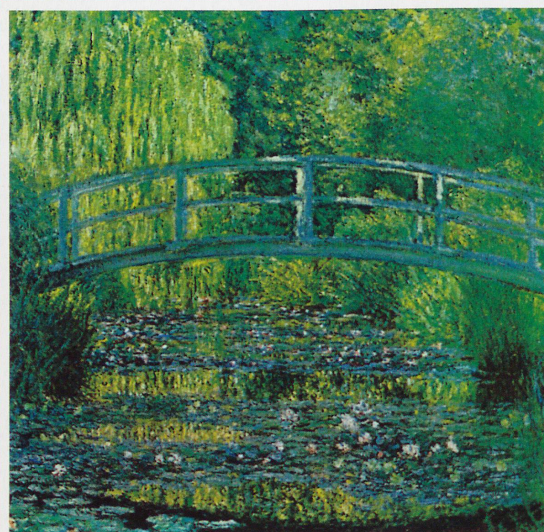
Les Nymphéas, Harmonie verte, 1899. (Musée d'Orsay, Paris)