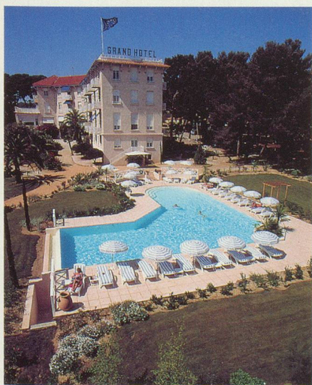
Le Grand Hôtel des Lecques

Prix par personne: Fr. 1250.- en pension complète (Supplément single Fr. 225.-)