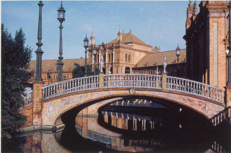
La Plaza de España, joyau de Séville

Le Palais de l'Alhambra à Grenade, l'ancienne mosquée de Cordoue, l'Alcazar de Séville, le rocher de Gibraltar. Autant de merveilles proposées aux lectrices et lecteurs qui participeront à ce voyage unique.