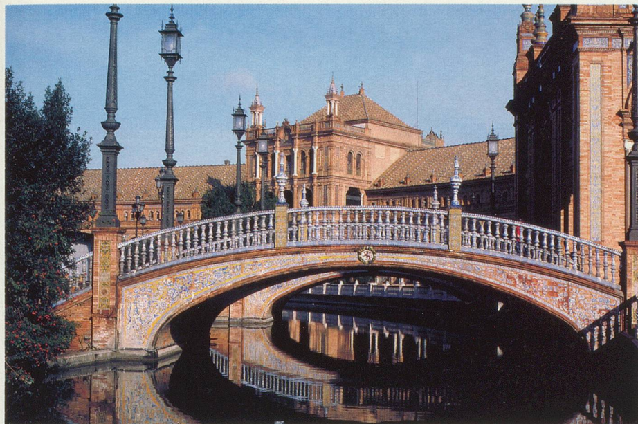
La Plaza de España, joyau de Séville

Le Palais de l'Alhambra à Grenade, l'ancienne mosquée de Cordoue, l'Alcazar de Séville, le rocher de Gibraltar. Autant de merveilles proposées aux lectrices et lecteurs qui participeront à ce voyage unique.