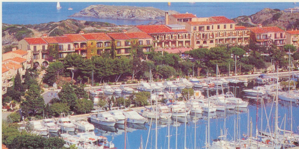
L'île des Embiez, calme et nature

Inclus dans le prix: transport en autocar (repas en route); logement en chambres doubles; demi-pension ou pension complète, vin et café; accompagnant depuis la Suisse.