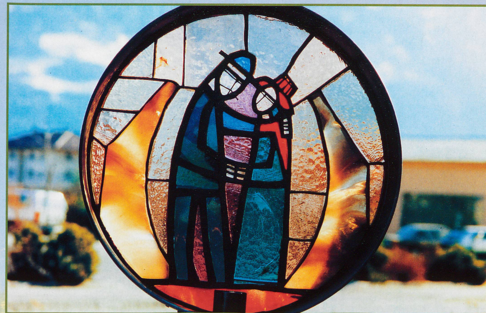
Il n'y a qu'une interdiction : celle de ne pas aimer !