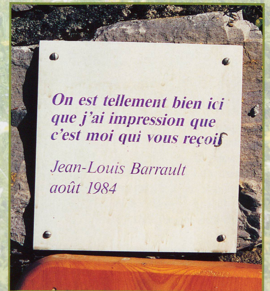
La plaque de l'irremplaçable Jean-Louis Barrault