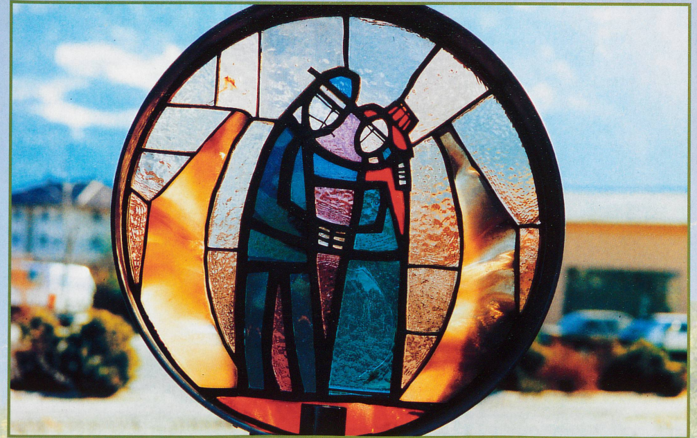
Il n'y a qu'une interdiction : celle de ne pas aimer!