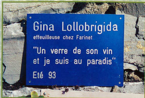
Gina Lollobrigida fut une effeuilleuse célèbre à Saillon