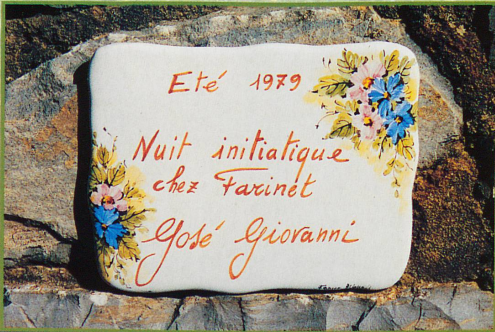
Une nuit inoubliable avec le cinéaste José Giovanni