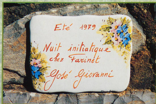
Une nuit inoubliable avec le cinéaste José Giovanni