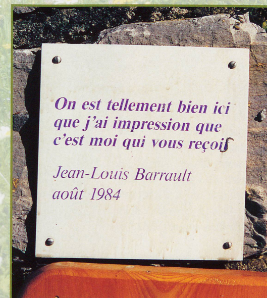
La plaque de l'irremplaçable Jean-Louis Barrault