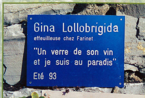
Gina Lollobrigida fut une effeuilleuse célèbre à Saillon