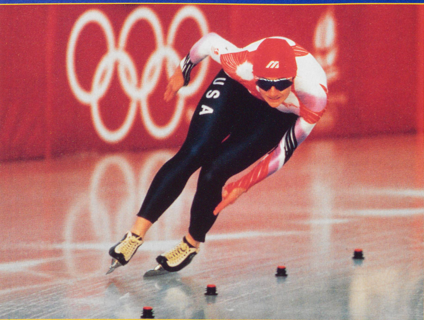
En patinage de vitesse, l'Américaine Bonnie Blair est une championne incontestée. Vous la verrez certainement aux Jeux de Nagano