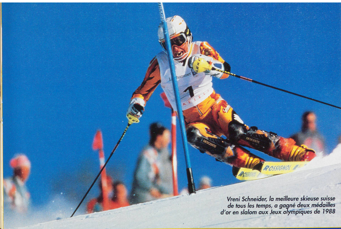
Vreni Schneider, la meilleure skieuse suisse de tous les temps, a gagné deux médailles d'or en slalom aux Jeux olympiques de 1988