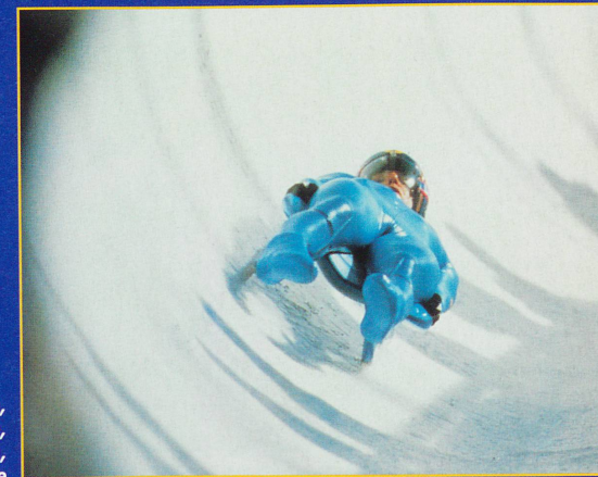
L'Allemande Steffi Walter-Martin, championne olympique de luge, fonce sur la piste à près de 100 km/h, harnachée comme un cosmonaute