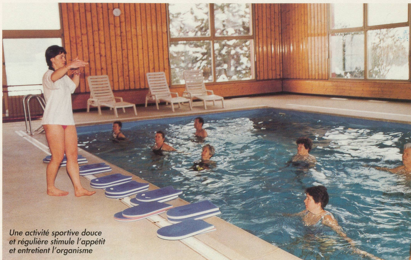
Une activité sportive douce et régulière stimule l'appétit et entretient l'organisme