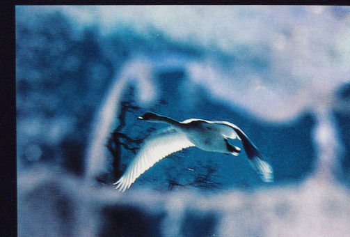
Majestueusement, une oie prend son envol