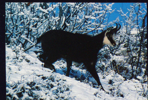
Les chamois prolifèrent sur les crêtes du Jura