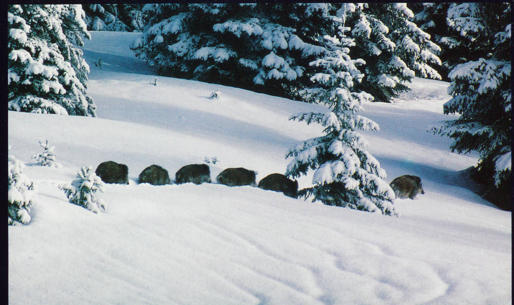
Une famille de sangliers en file indienne