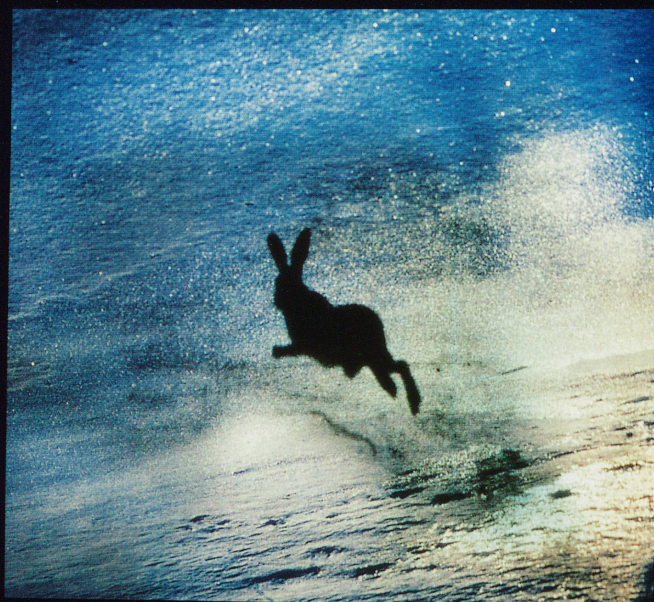
Le lièvre bondit dans un nuage de flocons