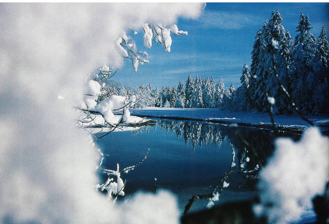
La sérénité hivernale à la vallée de Joux