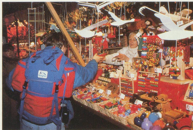
Le marché de Noël de Strasbourg

Vendredi 11 décembre. – Dans la matinée, départ en car vers Eguisheim, village réputé pour ses vins. Dégustation à la Cave Beyer. Déjeuner dans la région. Vers 16 heures, visite de Kayersberg, le village du Dr Schweitzer, célèbre pour ses expositions de décorations de Noël. Retour pour le dîner. Soirée libre. Samedi 12 décembre. – Après le petit déjeuner, débarquement et