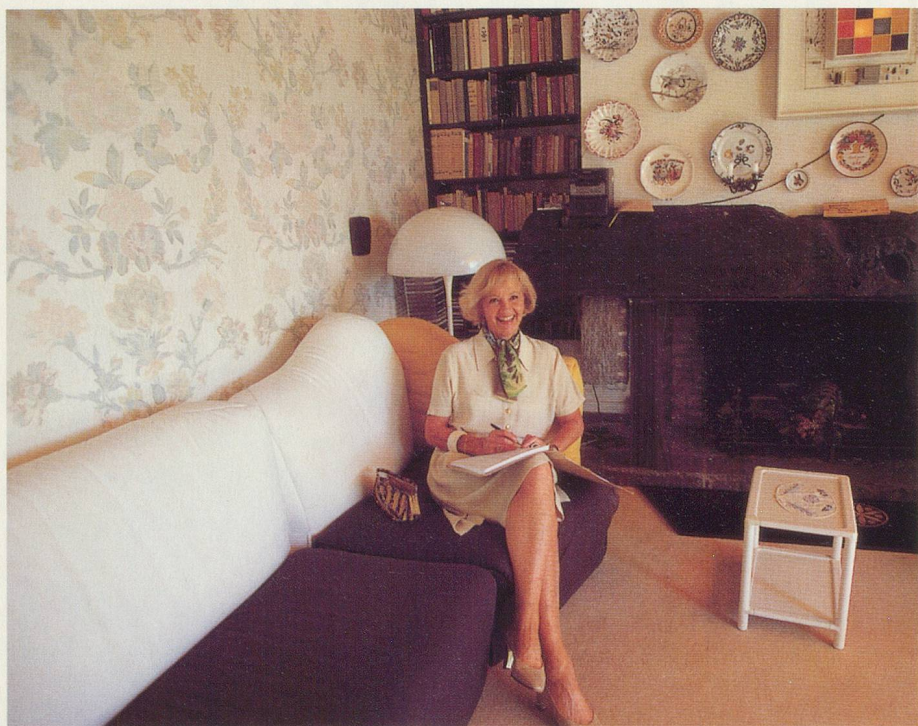
L'actrice anote les faits importants dans son journal

► jalousie. Je devais me fâcher, l'invectiver. Finalement, il m'a dit: «C'est bon, je vous engage!»