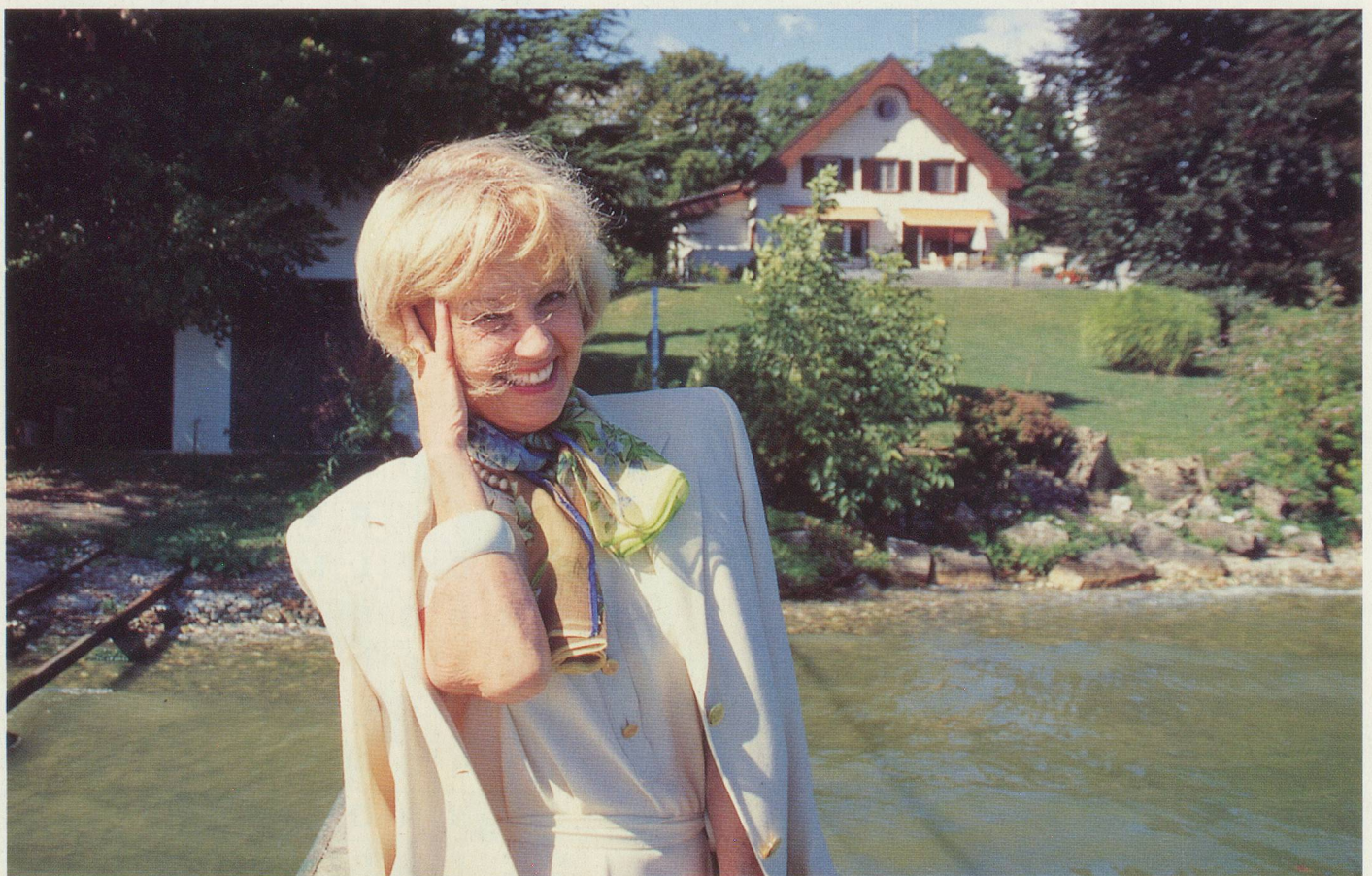
Liselotte Pulver, dans un décor qui lui est familier

De retour à Perroy, entre deux tournages, entre deux voyages, elle retrouve ses voisins et ses amis, des