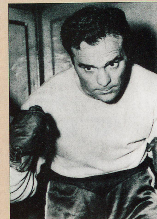
Les Français suivent avec passion le match de boxe de Marcel Cerdan, qui meurt l'année suivante