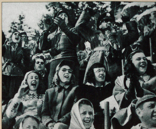
Les Jeux Olympiques d'hiver à Saint-Moritz enthousiasment le public