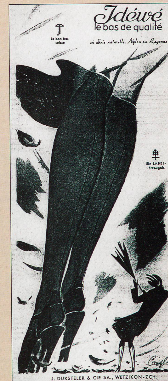
Les maisons suisses proposent des bas en nylon